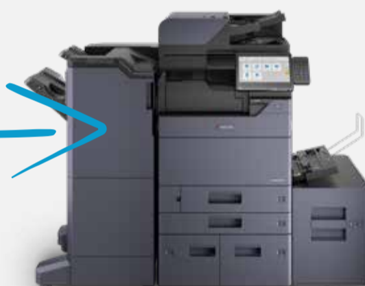
TASKalfa 3554ci (Lanciata nel 2021)