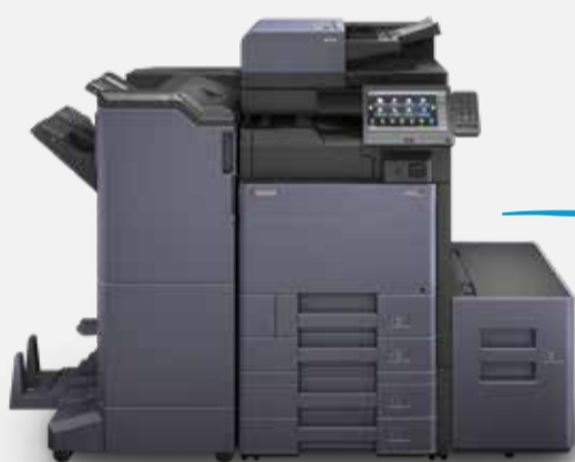
TASKalfa 3253ci (Lanciata nel 2019)

Dotati della più recente tecnologia di Intelligenza Artificiale, i sistemi consentono agli utenti di evidenziare o sovrascrivere le parti scritte a mano di un documento senza modificare il formato o l'immagine durante la scansione. Inoltre, l'innovativa funzione Super Resolution basata su IA consente di migliorare visibilmente la bassa qualità di risoluzione di immagini e loghi.