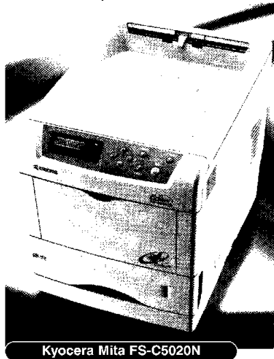
Kyocera Mita FS-C5020N

Una nuova serie di stampanti laser mono desktop, ha dato il via alle novità